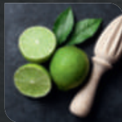
1 TL Limettensaft