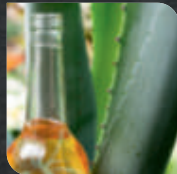
2 TL Agavensirup