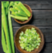
1 Stängel Sellerie (in Scheiben geschnitten)