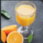
500 ml Orangensaft