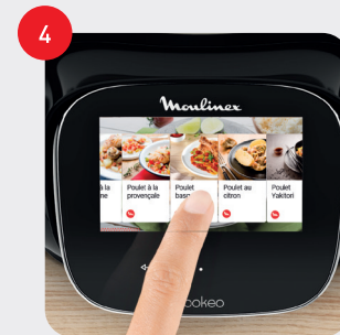
Appuyez sur la recette « poulet basquaise » Touch the "basque chicken" recipe