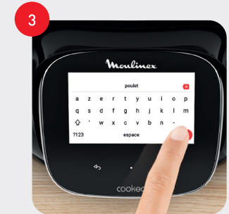
Tapez « poulet » et cliquez sur OK Enter "chicken" and click OK