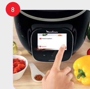
PREMIÈRE ÉTAPE : Préparez vos ingrédients FIRST STEP: Prepare your ingredients