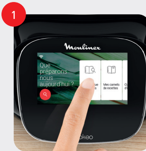
Appuyez sur « bibliothèque de recettes » Touch the "recipe library"