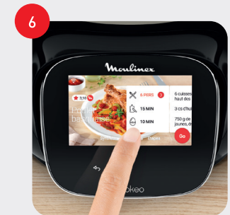
Accédez aux différentes étapes de la recette Access to the different steps of the recipe