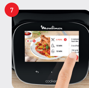
Appuyez sur GO pour commencer Touch GO to start