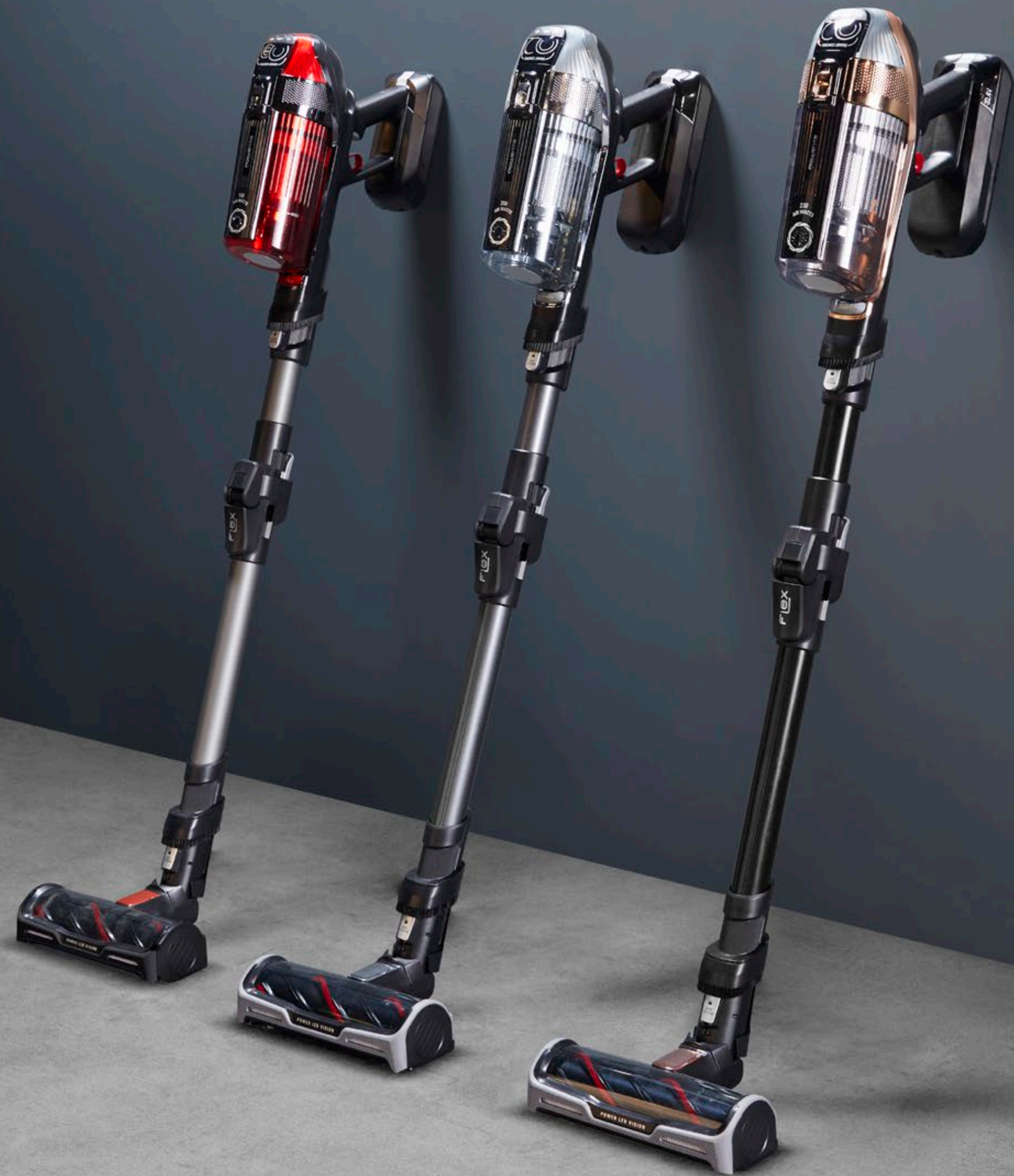
Aspiradora versátil sin cable X-FORCE