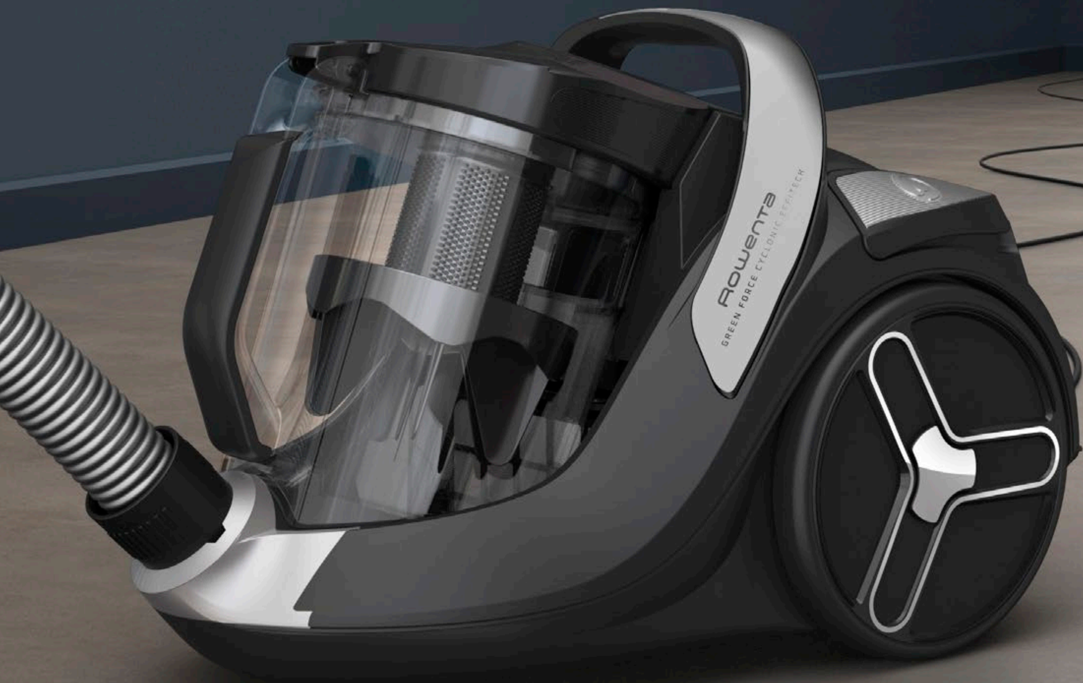
Aspiradora sin bolsa con cable Green Force Cyclonic Effitech