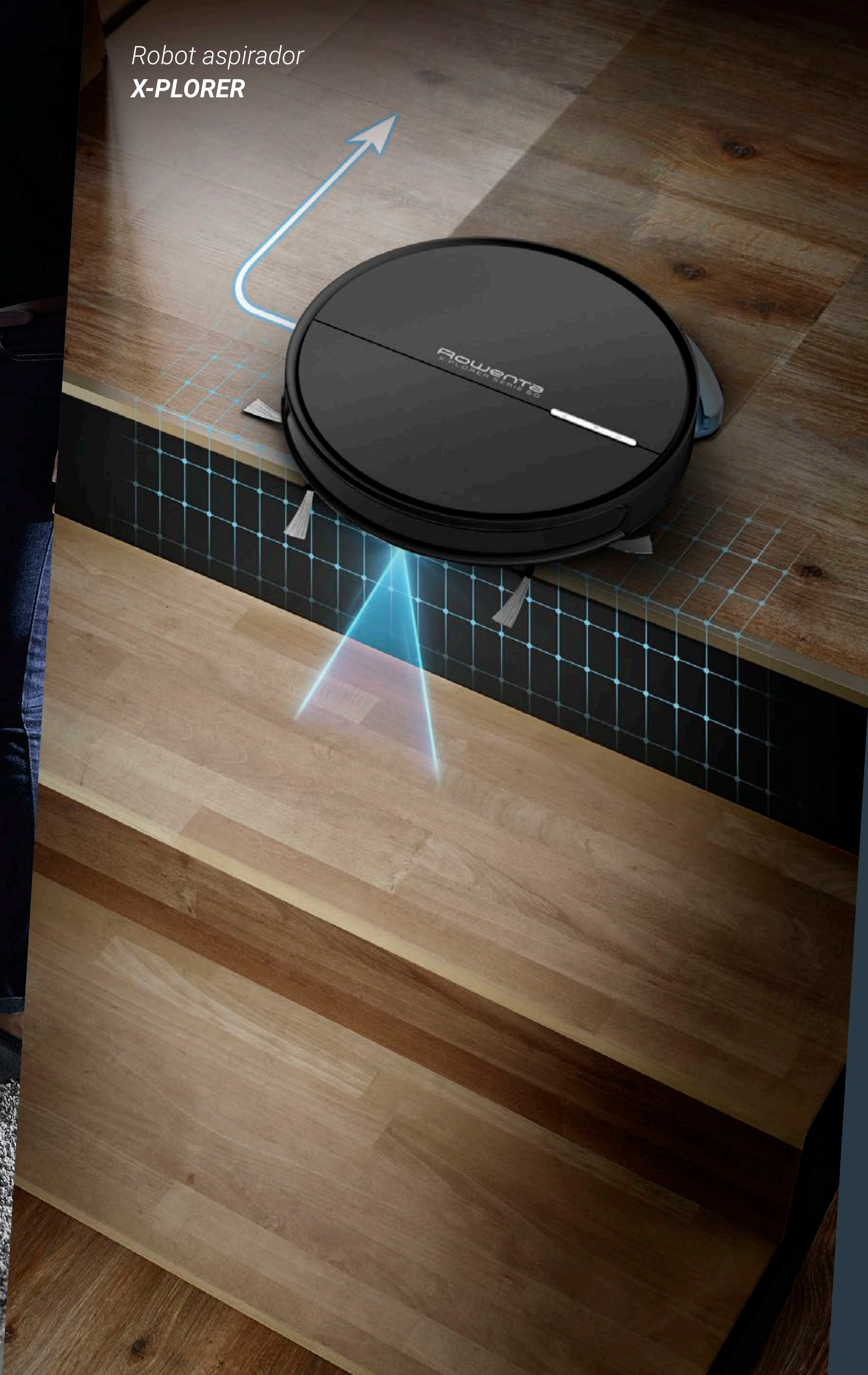
Robot aspirador X-PLOERER