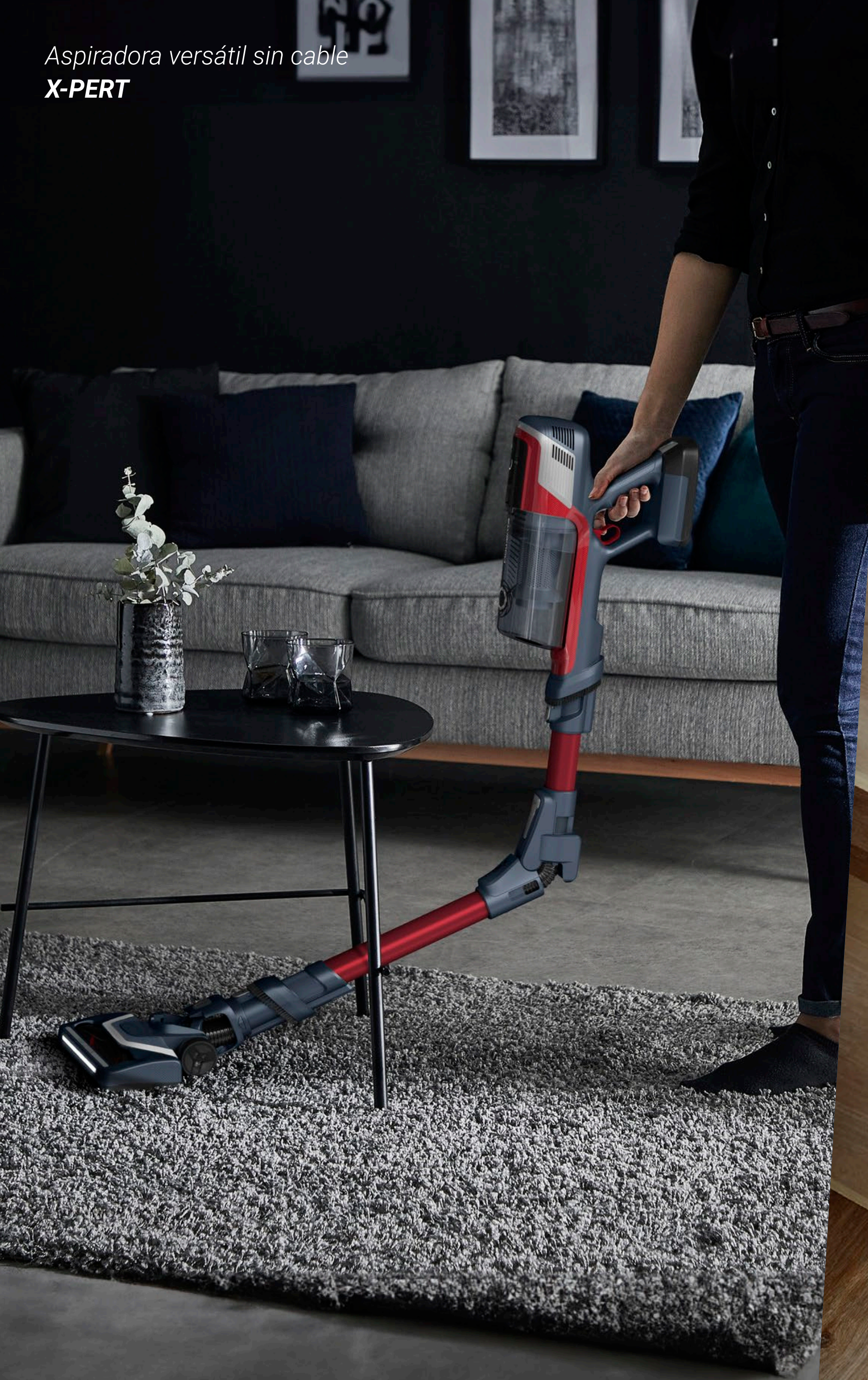
Aspiradora versátil sin cable X-PERT