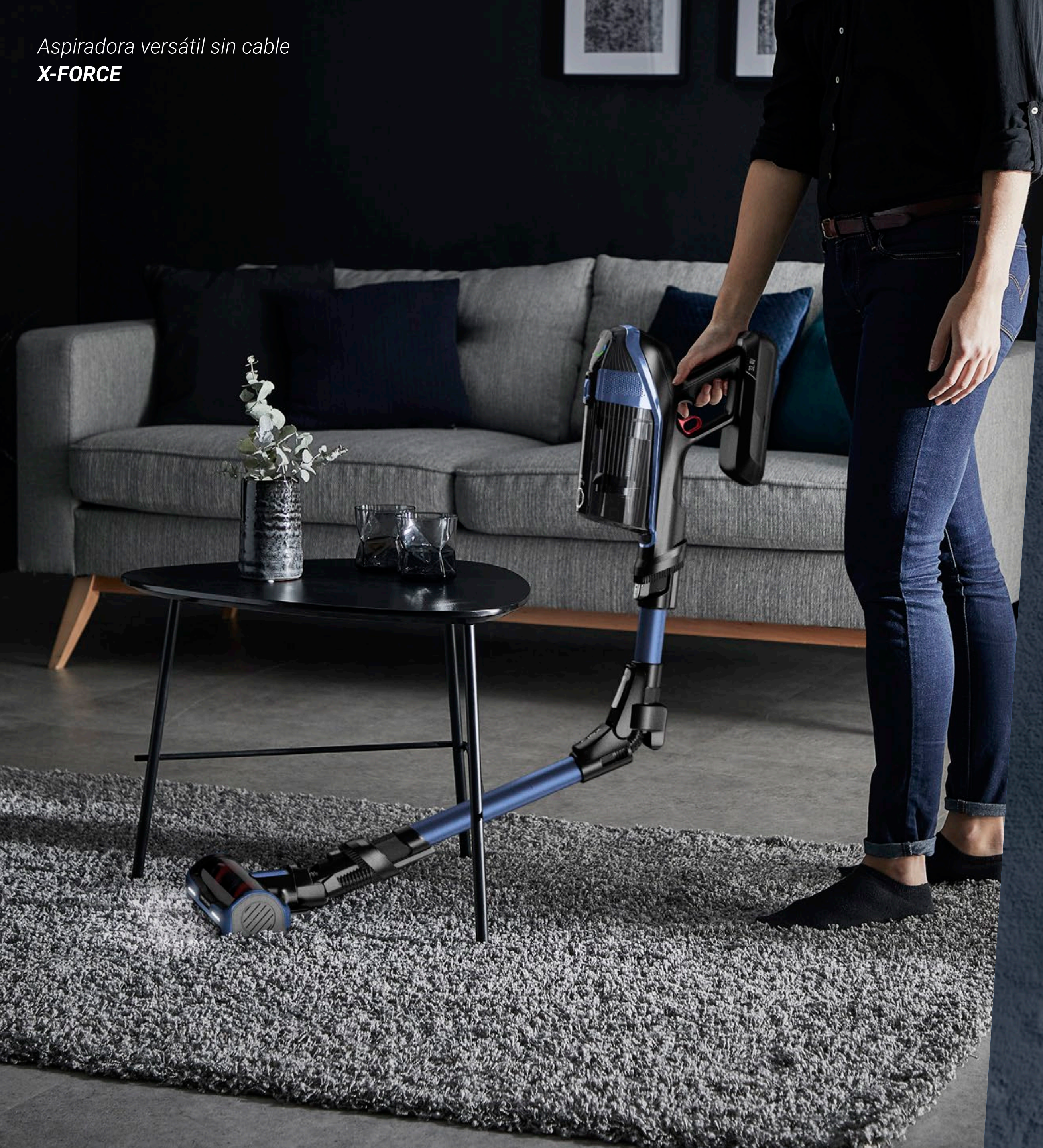
Aspiradora versátil sin cable X-FORCE