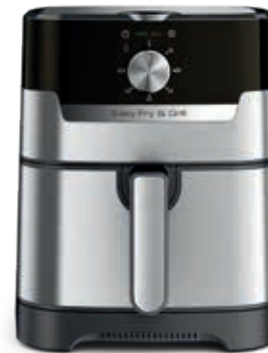
EASY FRY & GRILL CLASSIC+