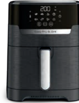
EASY FRY & GRILL PRECISION