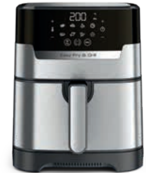
EASY FRY & GRILL PRECISION+