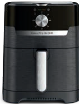
EASY FRY & GRILL CLASSIC