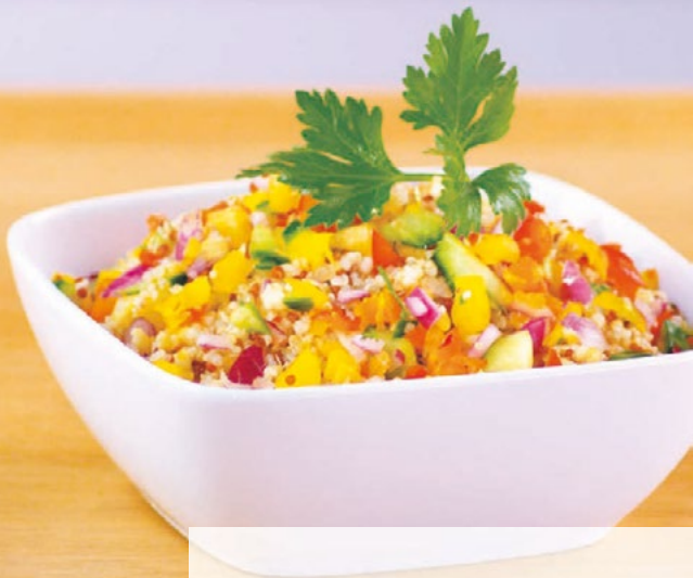
Salát z quinoi