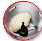
mes om te kneden/hakken