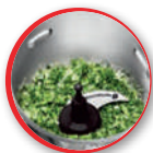
le couteau hachoir ultrablade