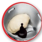
le couteau pétrin / concasseur