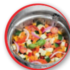
le panier vapeur