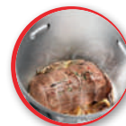
le fond xl